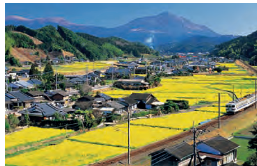
Typisch japanische Landschaft

Tor zu schwimmen und bildet mit dem roten Balkenwerk einen überaus malerischen Anblick. Nachmittags Fahrt mit dem Shinkansen-Superexpress-Schnellzug bis Osaka und von dort mit einem Lokalzug bis zum Mt. Koya. Im Laufe des Nachmittags Ankunft auf dem Klosterberg und Gelegenheit, den Kongobuchi-Tempel sowie die Grabstätten von Kobo Daishi zu sehen. Der Koya-Berg ist berühmt als Zentrum der buddhistischen Shingon-Sekte, deren Tradition bis auf das Jahr 816 zurückgeht. Auf den abgeflachten Gipfeln befinden sich heute 154 Tempel. Wir werden in einem dieser Tempel übernachten und ein vegetarisches Abendessen einnehmen.