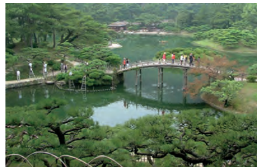
Ritsurin Bonsai-Garten, Takamatsu Unten: Itsukushima-Schrein, Miyajima